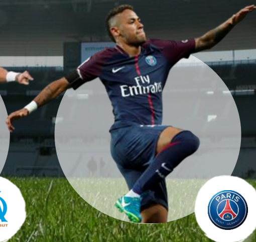
Neymar Paris Saint Germain