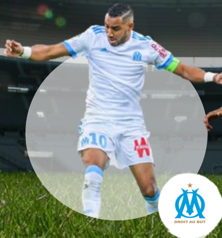
Dimitri Payet Olympique de Marseille