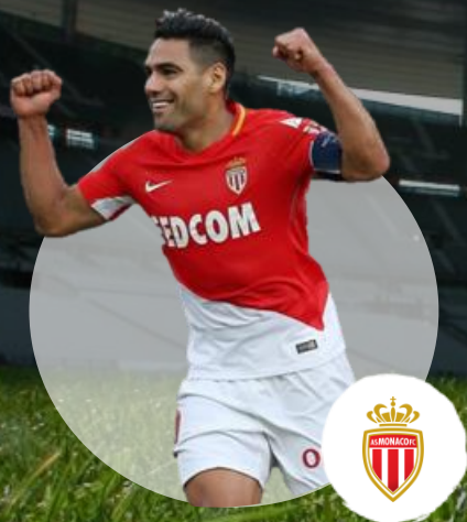
Radamel Falcao As Monaco