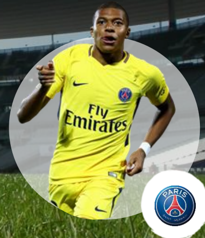
Killian Mbappé Paris Saint Germain

SOURCE(S) : Médiamétrie / Traitement MMW / Base 4+