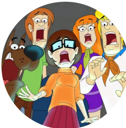
SCOOBY-DOO™ H-B Prod © 2016 TBS, Inc.

Le quotidien d'animaux aux personnalités étonnantes et décalées comme Maurice, un manchot qui se prend pour un tigre, Fred le phacochère crooner ou encore Gilbert le tarsier paranoïaque, et tous ça, sous la caméra d'un reporter.