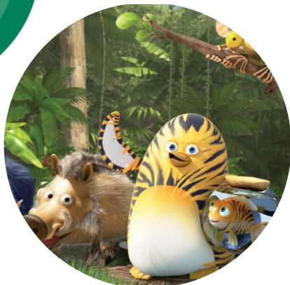
Les As de la Jungle © TAT productions – Master Films – Vanilla Seed / 2016