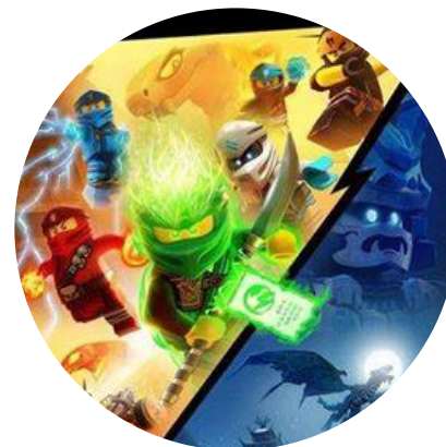
LEGO NINJAGO - based on characters, storylines, and concepts created by The LEGO Group.

Les années de lycée faisant désormais parties du passé, la bande de Scooby-Doo prend la décision de partir en voyage à bord de sa Mystery Machine.